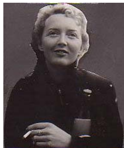
Edit Meyer Svensen